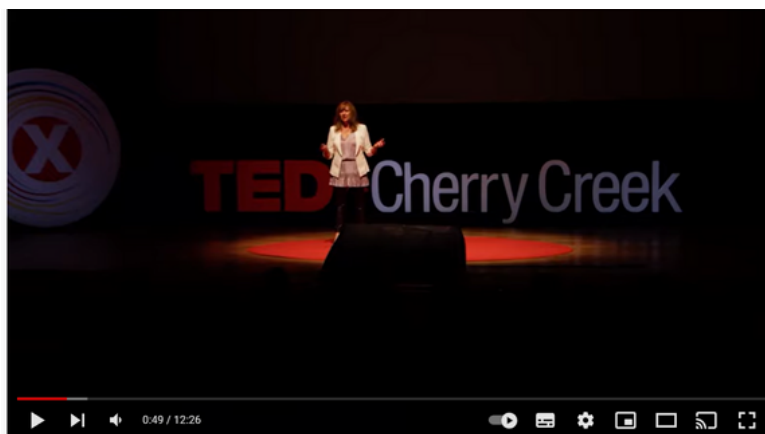
Media Literacy - The Power (and Responsibility) of Information | Lisa Cutter | TEDxCherryCreekWomen

Ο γραμματισμός στα μέσα επικοινωνίας και ενημέρωσης μας βοηθά να αναλύουμε τις πληροφορίες από διάφορες οπτικές γωνίες. Με τόσες πολλές πηγές πληροφοριών σήμερα, οι δεξιότητες κριτικής σκέψης μπορούν να βοηθήσουν τους ανθρώπους να φιλτράρουν τις πηγές και να αναγνωρίζουν τις αξιόπιστες πηγές.