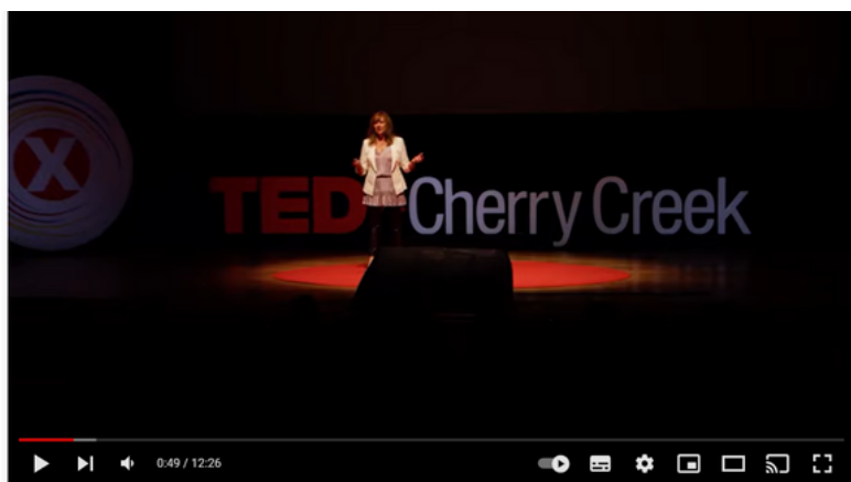
Media Literacy - The Power (and Responsibility) of Information | Lisa Cutter | TEDxCherryCreekWomen

A literacia mediática ajuda-nos a analisar informação a partir de uma variedade de pontos de vista. Com tantas fontes de informação hoje em dia, as habilidades de pensamento crítico podem ajudar as pessoas a identificar fontes confiáveis e filtrar através do ruído para chegar à verdade.